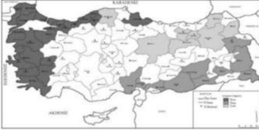
Harita-1.1 Türkiye’de Yaşayan Rom, Dom ve Lom’ların Dağılımı

etnik gruplara da ayrılmış durumda olup aşağıda harita üzerinde söz konusu gruplar çıkarılmıştır.