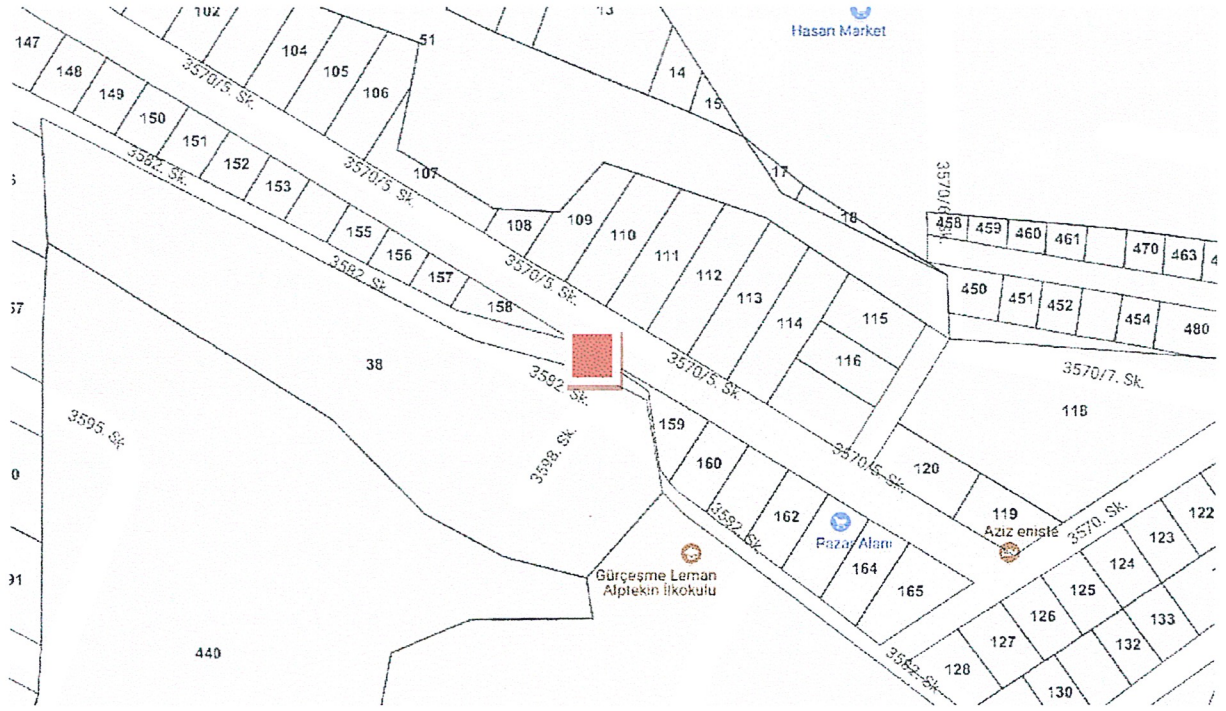
Şekil 3: Mülkiyet Durumu

Tüm yerleşmelerde olduğu gibi, gelişen teknoloji ve gereksinimler doğrultusunda ana enerji dağıtımını yetersiz kalmaktadır. Enerji dağılımının sağlıklı yapılabilmesi ve AG-YG Elektrik Tesisini sağlamak amacı ile rapor ekinde yer alan plan değişikliği paftası sunulmuştur.