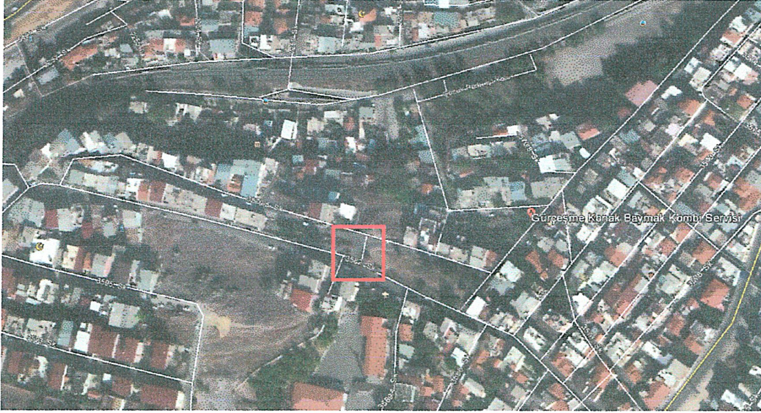
Şekil 1: İmar Planı Değişikliği Alanının Uydu Görüntüsü

İmar Planı Değişikliğinin amacı, çevresindeki yerleşim birimlerinin enerji altyapısındaki eksikliğin giderilmesi için güncel imar planları üzerine trafo gösteriminin yapılmasıdır.