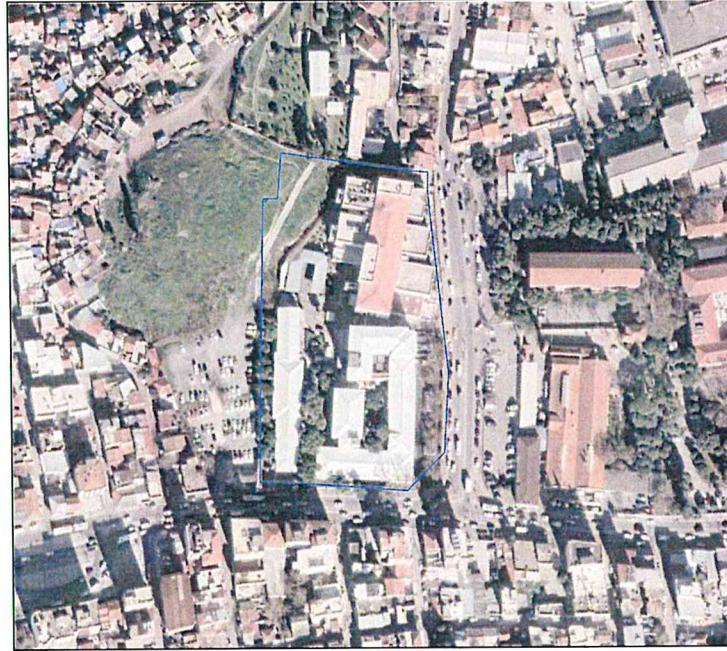
Resim 1: Planlama Alanının Uydu Görüntüsü

Planlama alanının içerisinde yer aldığı Tepecik Mahallesi, İzmir İlinin merkezinde yer alan Konak İlçesinde yer almaktadır.