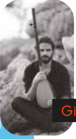
Gilad Weiss 'İsrail'

Virtüöz enstrümanist Gilad Weiss, çok erken yaşlardan itibaren gitar çalmaya başladı ve İsrail'in en ünlü gitaristlerinden Marak Chaoch'un en başarılı öğrencisi oldu .Çocukluk döneminden itibaren sahnede çalan Weiss, Türk Halk Müziği ve Klasik Türk Müziğinin etkisinde kaldı ve bu müziklere aşık oldu. Bu vesile ile pek çok ünlü müzisyenle çalışma fırsatı buldu. Bu isimlerden başta geleni hem çağdaş hem de Türk Halk Müziğinin günümüzde ve çağımızdaki en bilinen ismi, kopuz çalma geleneğini yeniden ihya eden perdesiz gitarın mucidi Erkan Oğur. Gilad kopuz, perdesiz gitar ve bağlamada büyük bir hızla ilerleyerek ilgi çekici performanslar sergiledi. Klasik ve modern batı müziği konusundaki geniş bilgisi ile eski ve yeniyi, melodi ve armoniyi eskimeyen bir yenilikle bir potada eritmektedir.