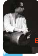
Bijan Chemirani 'İran - Fransa'

Hussein müzik için insanlara şu mesajı veriyor, "Birbirimiz daha çok sevmeli ve değer vermeliyiz. Anın tadını çıkarın. Kabul edin ve değer verin."