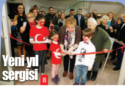
Yeni yıl sergisi 8

Konak Belediyesi ailesi olarak bu yıl da geleneği bozmadık ve düzenlediğimiz yeni yıl etkinliği ile 2019 yıla da hep beraber girdik. Kültürpark'ta gerçekleşen yılbaşı kutlamasında tüm çalışma arkadaşlarımızla bir aradaydık ve yeni yıl dilekelerimizi hep birlikte söyledik. ■ 8'de