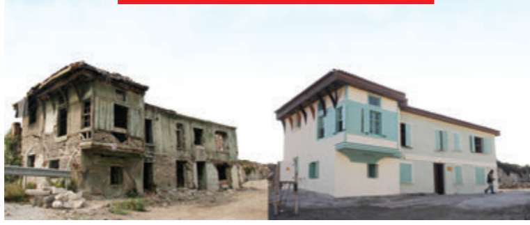
Agora Kaz Evi Öncesi ve Sonrası

türü türbe, sinagog, kiliselere yanıyor, yıkılmaya yüz tutmuş yapılar sanat merkezine, meydanlar modern sosyal yaşam alanlarına dönüşüyor.