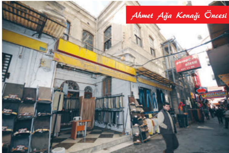
Ahmet Ağa Konağı Öncesi ve Sonrası

İzmir Tarih Projesi Tasarım Stratejisi Raporu İzmir Büyükşehir Belediyesi öncülüğünde katılımcı bir süreç esas