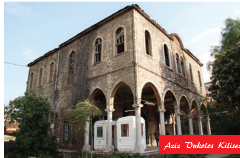
Aaiz Unkolos Kilisesi Öncesi

yaşayanlar, İzmirli ve alan ziyaretçileri. Tarihi alanda koruma ve canlandırma faaliyetlerinin bir arada gerçekleştirilmesi planlanan İzmir Tarih Projesi kapsamında aynı zamanda alandaki mevcut sosyal ve kültürel değerlerin korunarak alan kullanıcılarının çe-