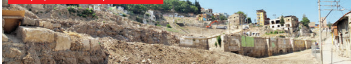
Ortaya Çıkan Antik Tiyatro Duvarları