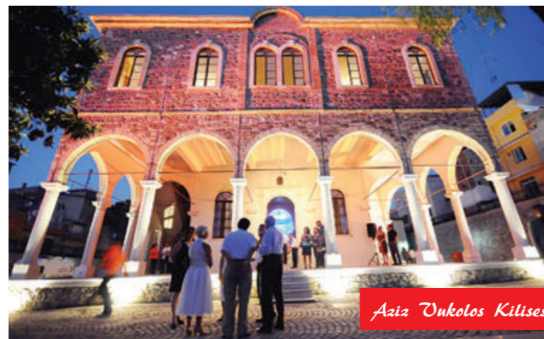
Aaiz Unkolos Kilisesi Sonrası