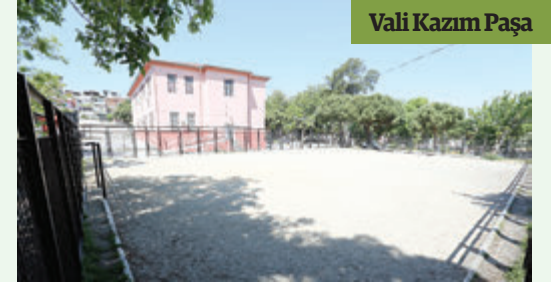
Vali Kazım Paşa

Halkapınar'da daha önce kurban satış alanı olarak kullanılan boş arazi de yapılan düzenlemeyle gençlerin futbol oynayacağı bir tesis dönüşecek. Yaklaşık 13 bin 760 metrekare olan arazi yeşil alanın yanı sıra spor alanı olarak da bölgeye kazandırılacak. Kurban Bayramı öncesinde satış alanı olarak kullanılan ve kirli bir görüntü yaratan alan projenin tamamlanmasıyla yepyeni bir görüntümler bölge halkına hizmet verecek. Bu alana da iki futbol ve bir basketbol sahası ile tartan pist yapılacak.