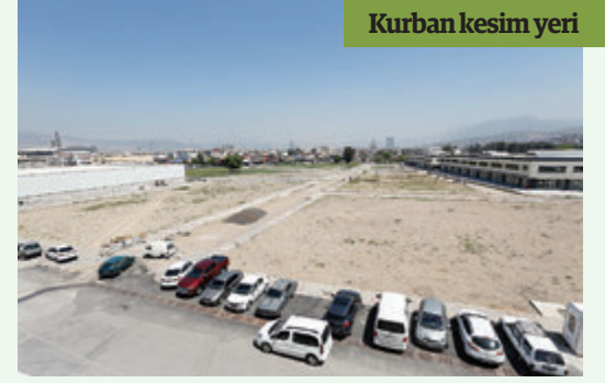
Kurban kesim yeri

AMATÖR spor kulluplerine verdiği destekle adından söz ettiren Konak Belediyesi bu kez başlattığı tesisleşme hamlesiyle de kulüplerin umudu oldu. Antrenman yapacak saha sıkıntısı çeken takımların yüzünü güldürecek yatırımlar için çalışmalara başlanırken, kısa sürede tamamlanması planlanan üç proje ile ilçeye modern üç yeni futbol sahası kazandırılması hedefleniyor. Sporu geniş kitlelere yaymak ve başarılı sporcular yetiştirmek amacıyla çalıştıklarını dile getiren Başkan Pekdaş, önceliklerinin ülkenin yarınları olan çocukların doya doya spor yapacakları yeni alanlar yaratmak olduğunu söyledi.