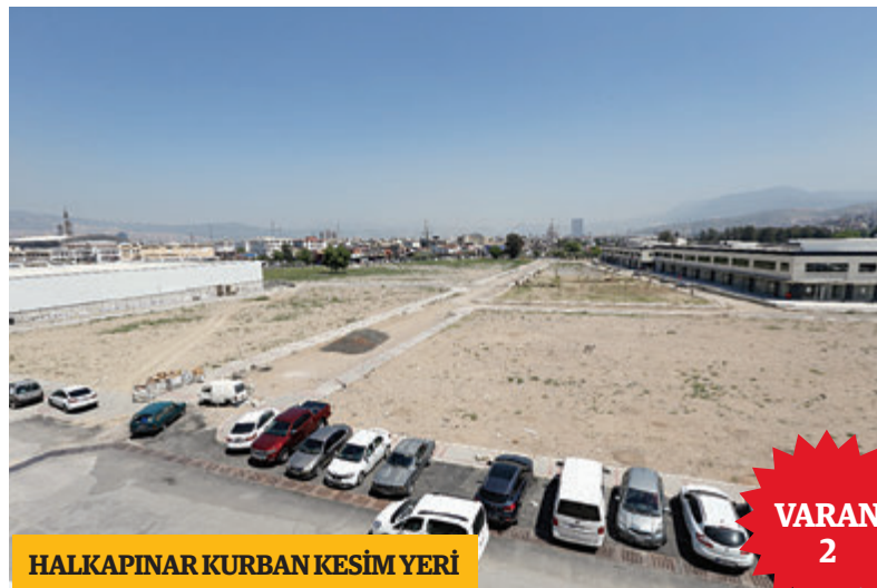
HALKAPINAR KURBAN KESİM YERİ