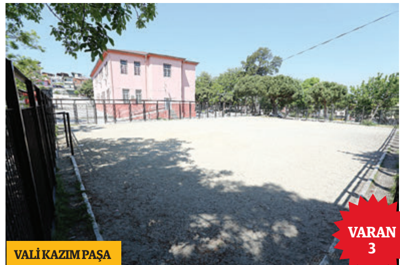
VALİ KAZIM PAŞA