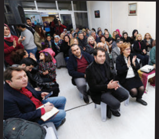
açılan Rehberlik ve Danışmanlık Merkezi'nin ikinci önümüzdeki günlerde Zeytinlik Mahallesi'nde hizmete girecek.

● Proje kapsamında kadınlar için ücretsiz 'hasta ve yaşlı refakatçi eğitimi' ile 'düz dikiş makinesi' eğitimi verilecek. Erkekler için de 'ayakkabıcılık' kursu düzenlenecek. Eğitim alan kursiyerler İŞKUR vasıtasıyla iş bulma imkânına da sahip olacak. Çalışma ve Sosyal Güvenlik Bakanlığı ile Avrupa Birliği (AB) tarafından finanse edilen projeye İzmir Ayakkabıcılar Odası Mesleki Eğitim Merkezi, Çağdaş Romanlar Derneği, Ege İhracatçılar Birliği, İŞKUR İl Müdürlüğü ve Konak Halk Eğitim Merkezi de destek veriyor. Proje kapsamında 1. Kadriye Mahallesi'nde