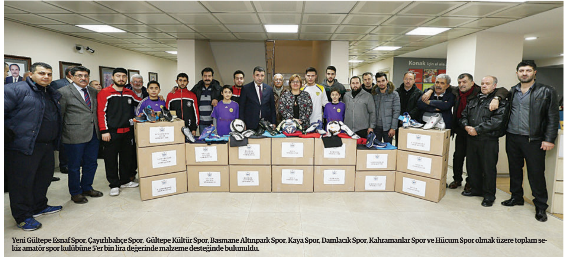
Yeni Gültepe Esnaf Spor, Çayırbağ Spor, Gültepe Kültür Spor, Basmane Altınpark Spor, Kaya Spor, Damlacık Spor, Kahramanlar Spor ve Hücum Spor olmak üzere toplam sekiz amatör spor kulübüne 5'er bin lira değerinde malzeme desteğinde bulunuldu.

Konak Belediyesi ilçedeki sekiz amatör spor kulübüne beşer bin lira değerinde malzeme desteğinde bulundu.