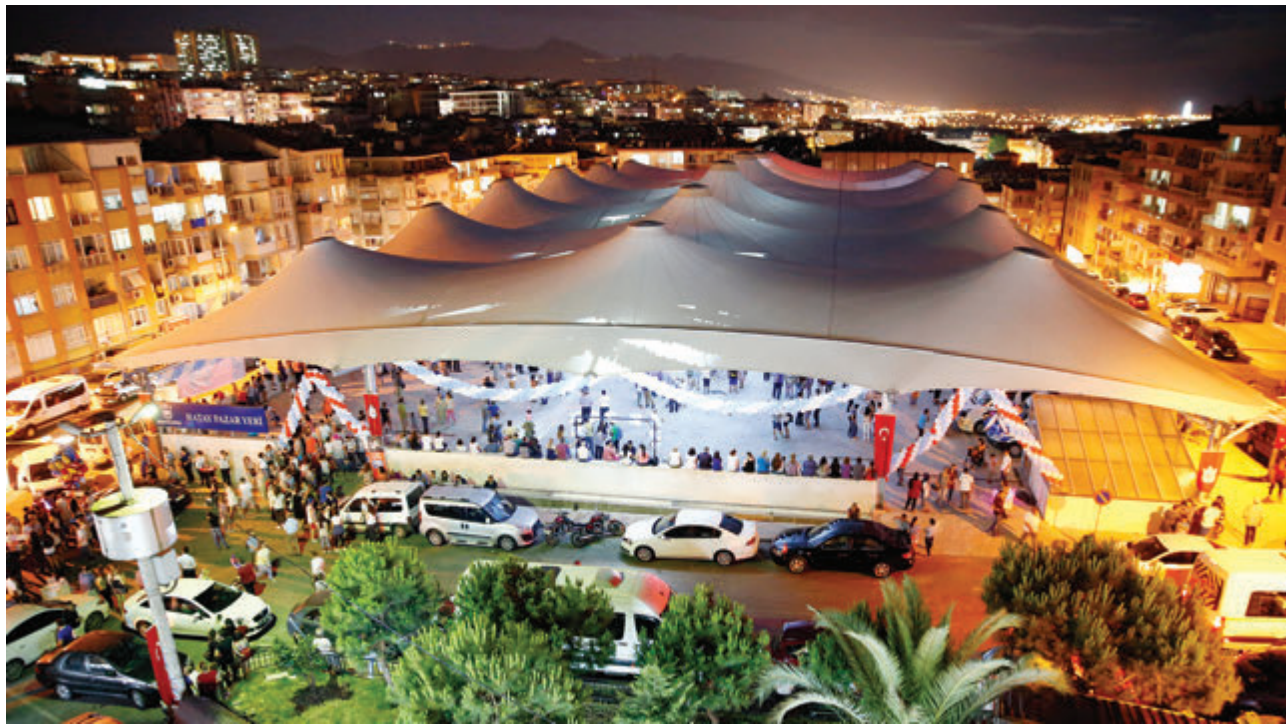
Hatay semtinde açılan kapalı pazaryeri, bölgede yaşayan vatandaşlara hizmet veriyor.