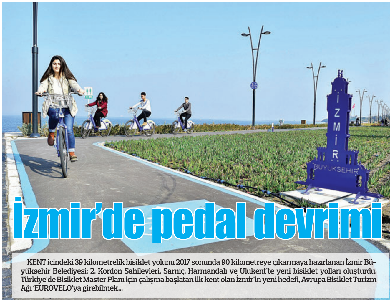
KENT içindeki 39 kilometrelik bisiklet yolunu 2017 sonunda 90 kilometreye çıkarmaya hazırlanan İzmir Büyükşehir Belediyesi; 2. Kordon Sahileleri, Sarnıç, Harmandalı ve Ulukent'te yeni bisiklet yolları oluşturdu. Türkiye'de Bisiklet Master Planı için çalışma başlatılan ilk kent olan İzmir'in yeni hedefi, Avrupa Bisiklet Turizm Ağı 'EUROVELO'ya girebilme...

İZMİR Büyükşehir Belediyesi'ne sayısız şampiyonluk getiren Sualtı Ragbisi Kadın Takımı, Türkiye Federasyon Kupası'nı bir kez daha kazanarak şampiyon oldu. Sualtı Ragbi Federasyon Kupası'nda 11 sezondur şampiyonluğu kaptırmayan İzmir Büyükşehir Belediyesi'nin kadın sporcuları, rakipsizliklerini bir kez daha kanıtladı. Ege Üniversitesi Sermed Akgün Kapalı Olimpik Yüzme Havuzu'nda düzenlenen Türkiye Sualtı Ragbi Federasyon Kupası'nda, Marmara Sualtı Kulübü'nü 10-0, Buz Sualtı'nı 5-2 ve İstanbul Sualtı'nı ise 14-0 yenerek yarı finale kalan İzmir Büyükşehir Belediyespor, finalde de Göztepe'yi 17-0 mağlup ederek şampiyonluk kupasını almaya hak kazandı.