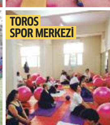
TOROS SPOR MERKEZİ