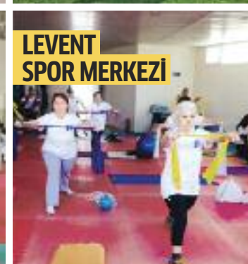
LEVENT SPOR MERKEZİ