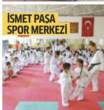
İSMET PAŞA SPOR MERKEZİ