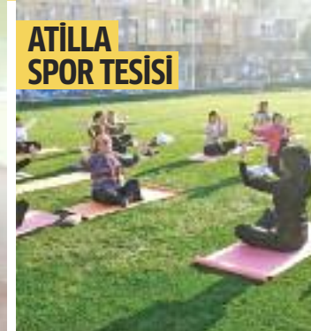
ATILLA SPOR TESİSİ