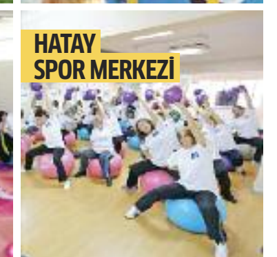
HATAY SPOR MERKEZİ