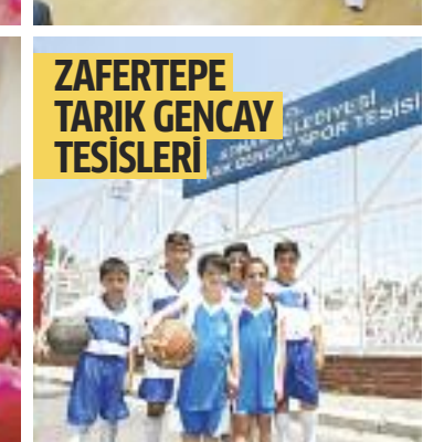
ZAFERTEPE TARIK GENÇAY TESİSLERİ