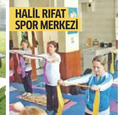
HALİL RIFAT SPOR MERKEZİ