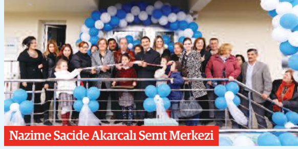
Nazime Sacide Akarcılı Semt Merkezi

PEKDAŞ: Kamusal alanlarımızı çoğalttık, çoğaltmaya da devam ediyoruz. Belediyeler insanların mutluluk ve esenliği için çalışır. Hemşehrilerimizin sosyalleştikleri, spor yaptıkları, çocuklarının sanatla, bilimle buluştuğu alanları çoğaltmak hedefindeyiz.