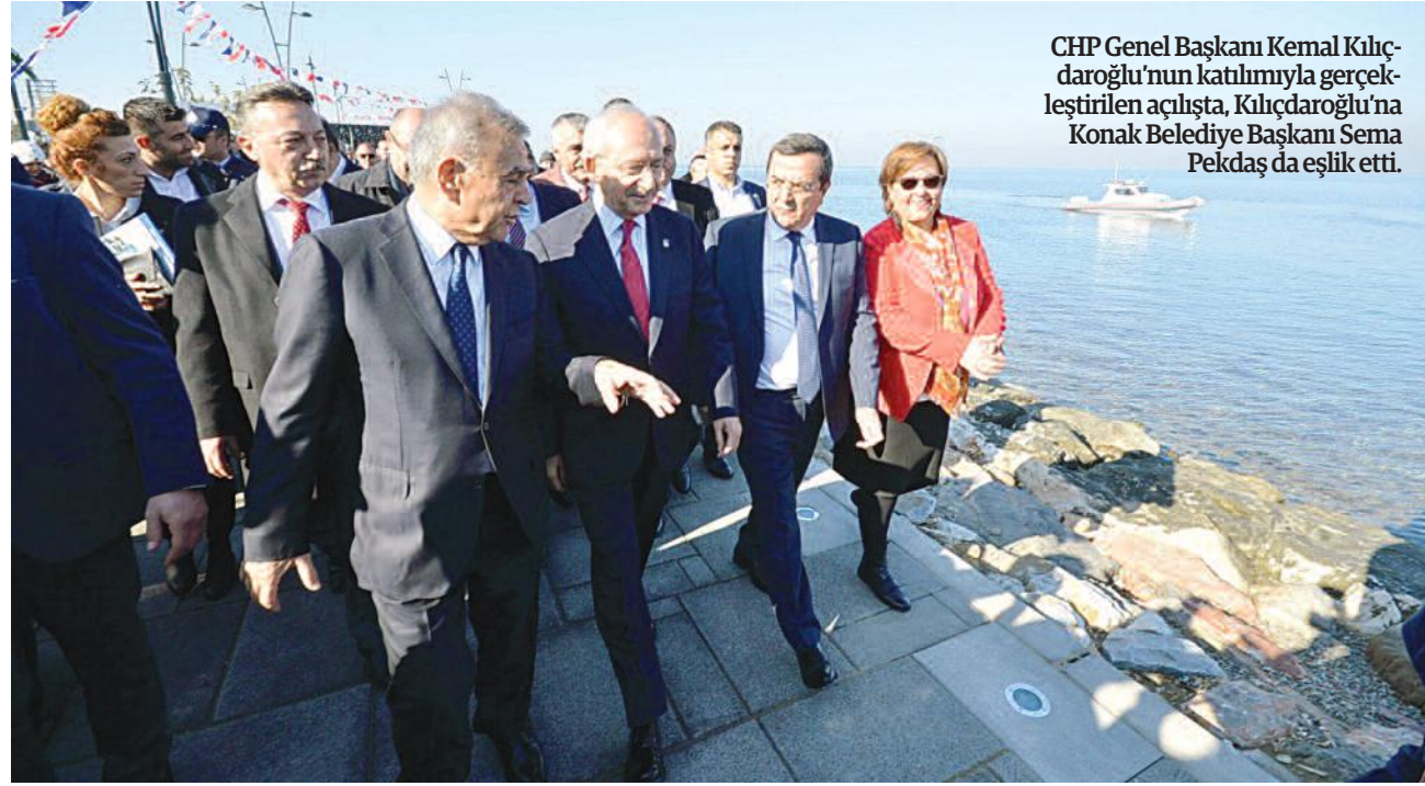
CHP Genel Başkanı Kemal Kılıçdaroğlu'nun katılımıyla gerçekleştirilen açılısta, Kılıçdaroğlu'na Konak Belediye Başkanı Sema Pekdaş da eşlik etti.

SAHİLEVLERİ , İzmir Büyükşehir Belediyesi'nin 'İzmir Deniz' projesi çerçevesinde yürüttüğü çalışmalarla yeşil dokusu, balıkçı iskeleleri, oturma ve seyir gruplarıyla bambaşka bir cehreye bürünüyor. Düzenlemenin ilk etabı Cumhuriyet Halk Partisi Genel Başkanı Kemal Kılıçdaroğlu'nun da katıldığı törenle hizmete açıldı. İzmir'in sayesinde Türkiye'nin nefes aldığını söyleyen CHP Genel Başkanı Kemal Kılıç-