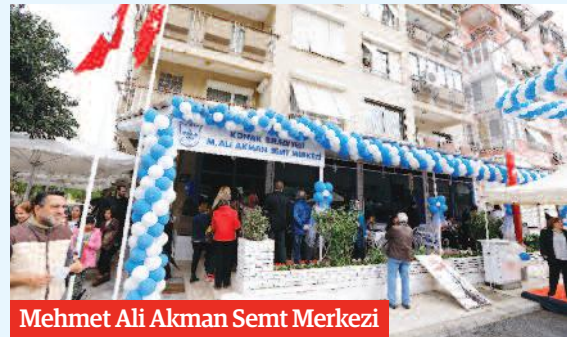
Mehmet Ali Akman Semt Merkezi