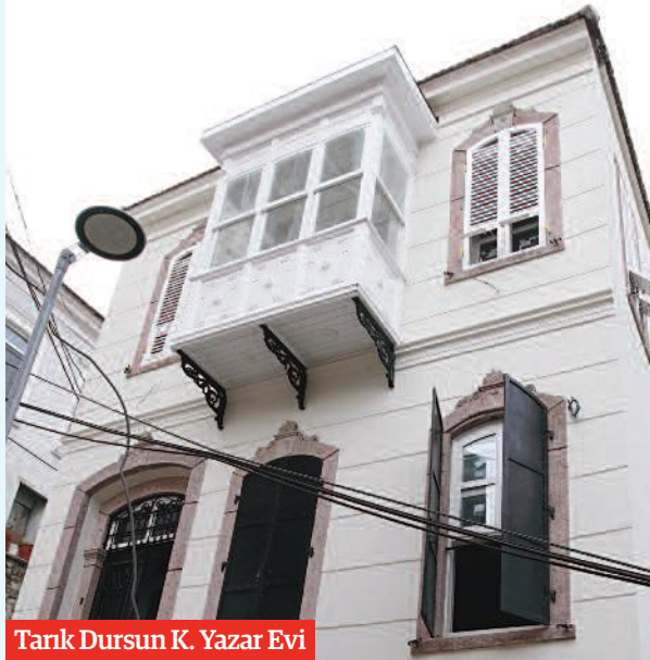
Tarık Dursun K. Yazar Evi