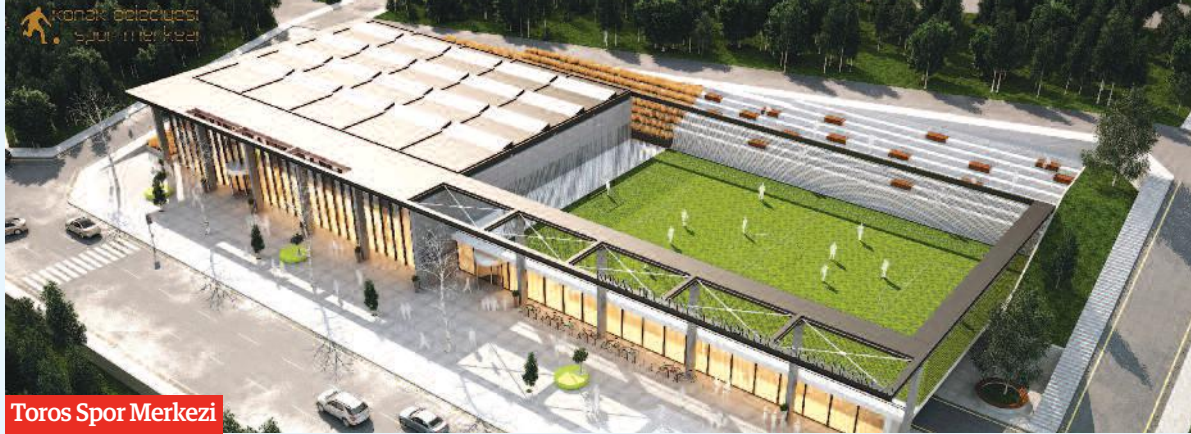
Toros Spor Merkezi

Yapılan yatırımlar arasında en büyük payı sokak aralarına kurulan pazarları kapalı pazaryerlerine taşımaya ayırdıklarını dile getiren Pekdaş, Eşrefpaşa, Toros, Yenişehir ve Kadifekale'de yeni kapalı pazaryerleri inşa etmek için büyük bir sorundu. Bu sorunu çözmek için Yağhaneler semtindeki Jandarma Bölge Komutanlığı'nın boşaltacağı yeri TOKİ'den 12 milyon TL'ye satın aldık. Şimdi buraya yakın zamanda içinde çeşitli sosyal donatıların da olacağı kapalı pazaryeri yapacağız. Ayrıca Toros Mahallesi'nde mevcut pazarın kurulduğu alanda kamulaştırmalar yaptık. Buraya da altı otopark, bir katı pazaryeri, üst katı da düğün salonu olacak bir pazaryeri yapacağız. Kadifekale'de oturan vatandaşlarımız için de bir pazaryeri çalışmamız var. 1. Kadriye'de kamulaştırmalar yaparak bir pazar yeri alanı oluşturduk. Çok yakın zamanda buraya da bir pazaryeri yapacağız" dedi.