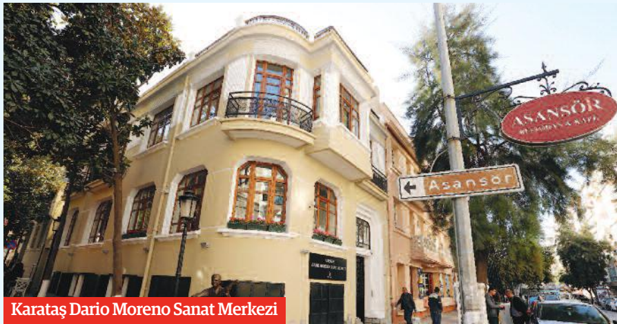
Karataş Dario Moreno Sanat Merkezi

Belediye hizmet birimlerinin sayısını çoğaltmak amacıyla kiralama yöntemine gittiklerini dile getiren Pekdaş, "Konak İzmir'in merkezi ve yaklaşık 8 bin 500 yıldır burada yerleşik yaşam kesintisiz devam ediyor. Dolayısıyla gelişen kentlerin gerektirdiği bazı hizmetler için yeni kamusal alanlara ihtiyaç duyuluyor. Konak'ta bu alanları bulmak zordu. Bu nedenle kamulaştırmalar yapmamız gerekiyordu. Biz bunu başardık. Kamusal alanlarımızı çoğalttık, çoğaltmaya da devam ediyoruz. Belediyeler insanların mutluluk ve esenliği için çalışır. Hemşehrilerimizin sosyalleştikleri, spor yaptıkları, çocuklarının sanatla, bilimle buluştuğu alanları çoğaltmak hedefindeyiz. Yeni spor ve semt merkezleri için Mehmet Ali Akman ve Toros'ta binalar kiralandık. Ayrıca Dairo Moreno Sokağı'nın girişindeki tarihi bir binayı kiralandık ve kurul onaylı tadilatını gerçekleştirerek burasını bir sanat merkezine dönüştürdük. Karataş adıyla tanınan çocuklarımızın sanatla buluştuğu bir alan oldu. Ayrıca İzmir Limanı'nın karşısında yer alan ve tarihsel bir mekan olmasına rağmen sadece arsa olarak görünen bir binamız vardı. Bu yeri tescilledik ve belediye hizmet alanı olarak da meclisten karar aldık. Burada da sosyal ve kültürel bir alan olarak hizmet vermeyi planlıyoruz" diye konuştu.