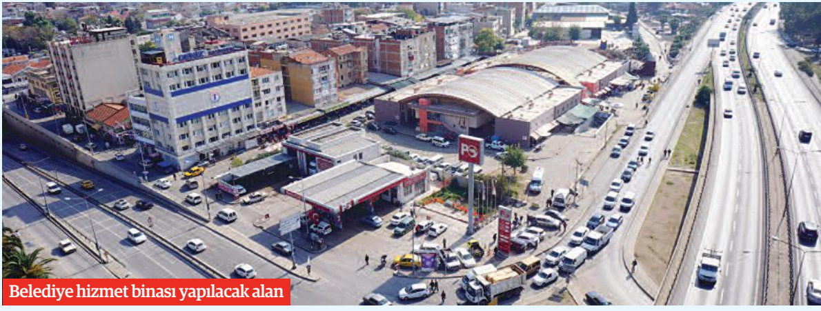
Belediye hizmet binası yapılacak alan

Pekdaş: Göreve geldiğimizde belediyeye ait bir mendil büyüklüğünde boş yerimiz dahi yoktu. İki yıllık süreçte hem yeni yatırımlar yaptık hem de yeni mülkler satın aldık.