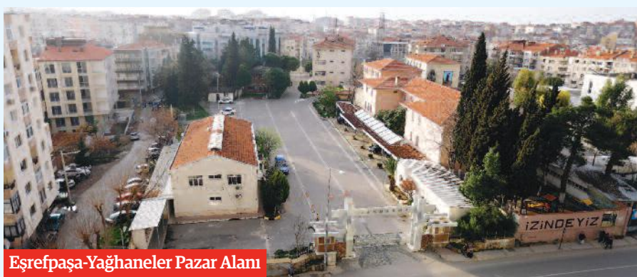
Eşrefpaşa-Yağhaneler Pazar Alanı