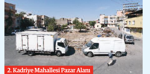
2. Kadriye Mahallesi Pazar Alanı

PEKDAŞ: Kamusal alanlarımızı çoğalttık, çoğaltmaya da devam ediyoruz. Belediyeler insanların mutluluk ve esenliği için çalışır. Hemşehrilerimizin sosyalleştikleri, spor yaptıkları, çocuklarının sanatla, bilimle buluştuğu alanları çoğaltmak hedefindeyiz.