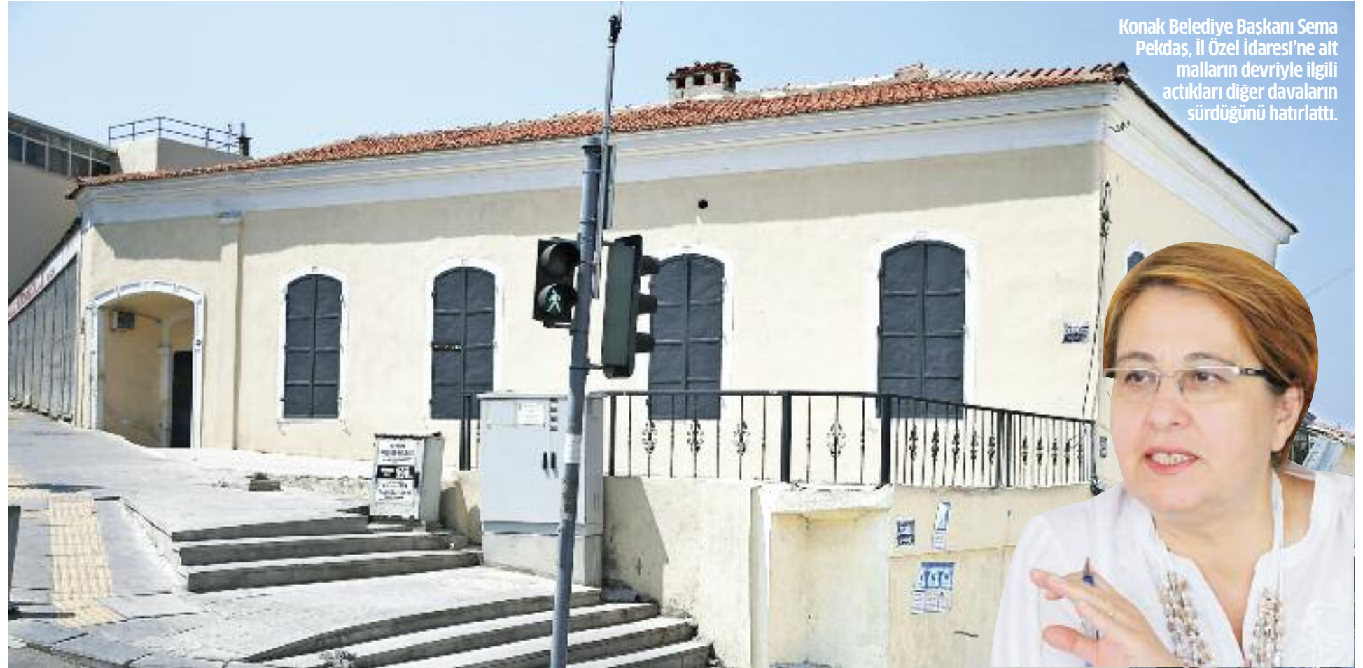
Konak Belediye Başkanı Sema Pekdaş, İl Özel İdaresi'ne ait malların devriyle ilgili açtıkları diğer davaların sürdüğünü hatırlattı.

İzmir İl Özel İdaresi'nden Valiliğe devredilen mülkler arasında yer alan İkiçeşmelik'teki tarihi İstiklal İlkokulu binası yargı kararıyla Konak Belediyesi'ne geçti.