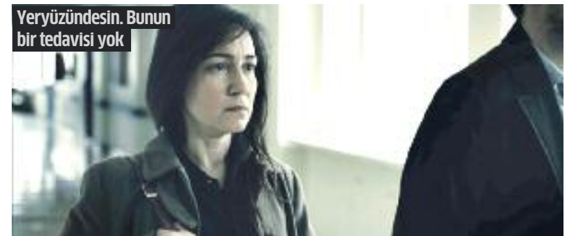
Yeryüzüdesin. Bunun bir tedavisi yok

Tavsan Kani / Yağmur Altan Bahçe / İdil Ar Ucaner Arkhe / Batuhan Koksak Önyargı / Fatih Yasar Mandrake / Ayberk Kaya