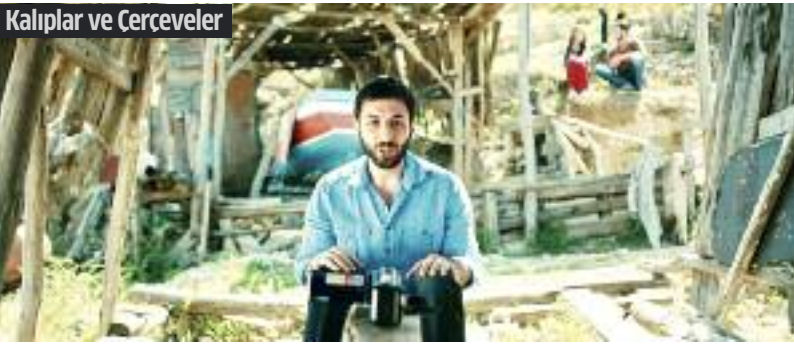
Kalıplar ve Cerceveler

Uluslararası İzmir Kısa Film Festivali 1-6 Kasım tarihleri arasında 400'ün üzerinde filmi ücretsiz olarak sinemaseverlerle buluşturacak.